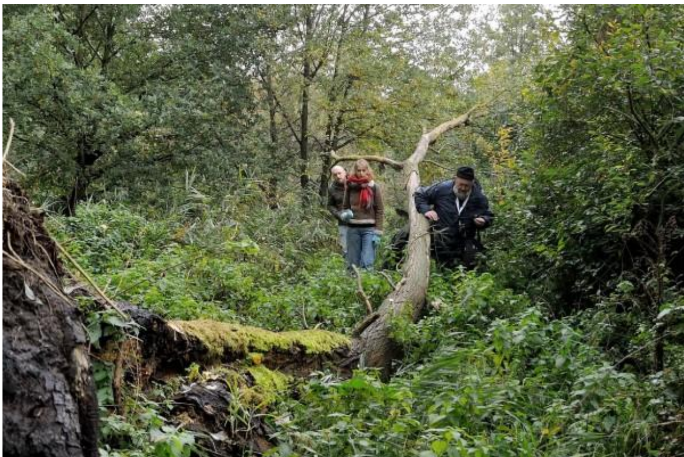
Kwestie van het niet te verleren