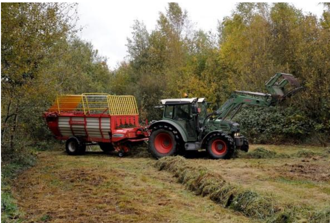
En na onze doortocht werd alles netjes opgeruimd