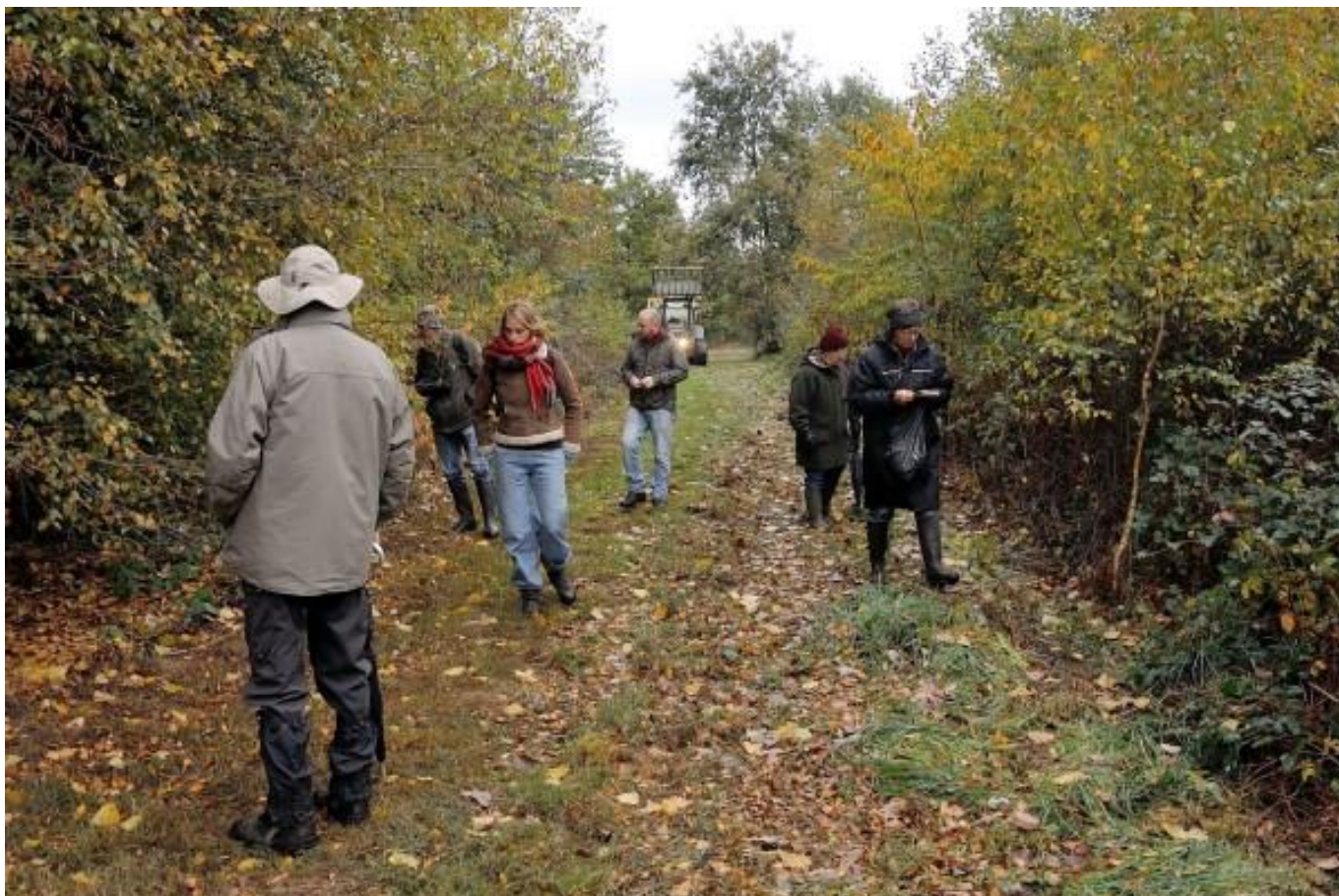
De paden waren netjes gemaaid