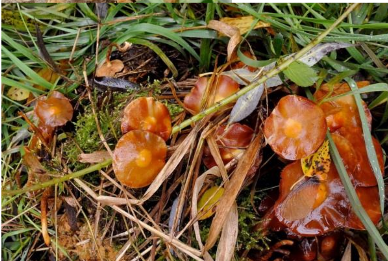
En een familie stobbezammetjes